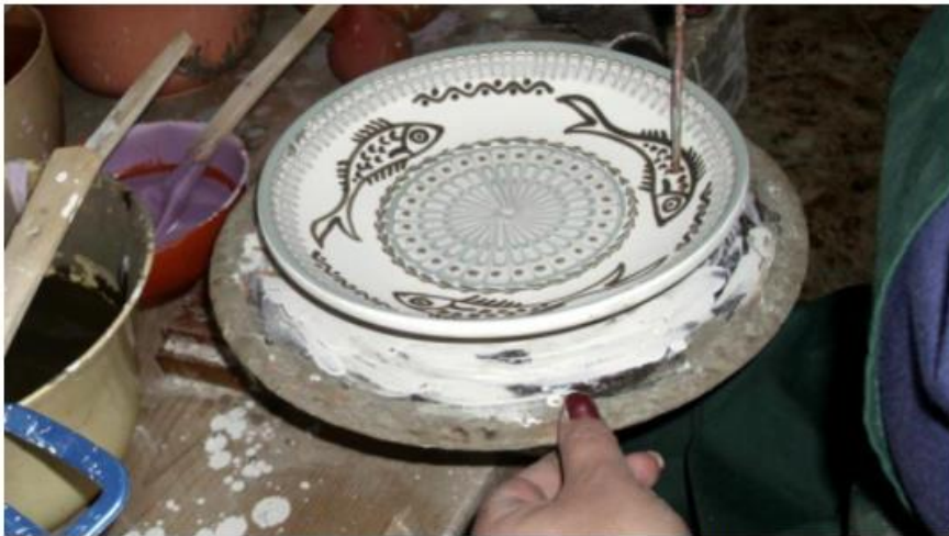
Universitatea din București a lansat un proiect pentru protejarea și valorificarea tradițiilor și elementelor din folclorul românesc