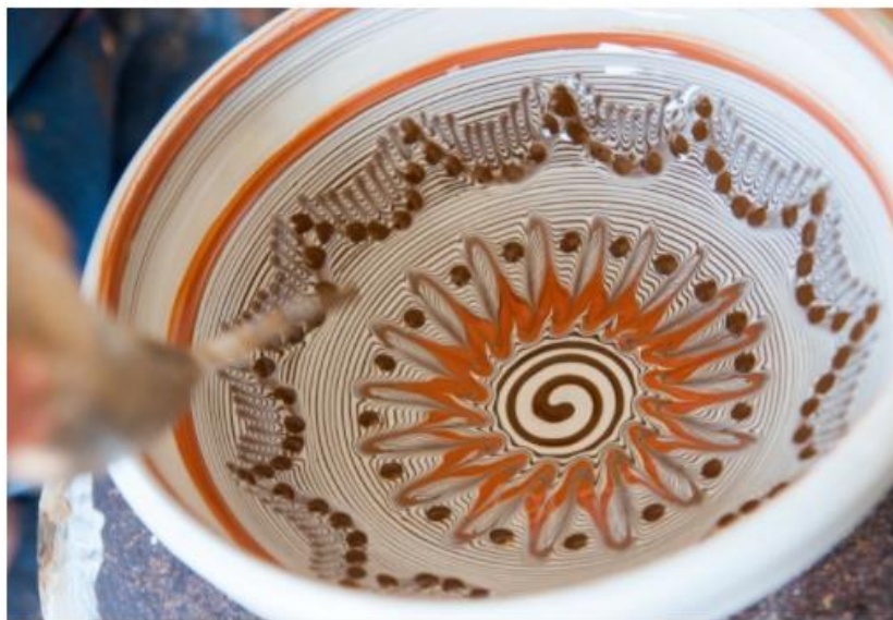
Vas de ceramică - ultima etapă de decorare, Horezn, Vâlcea

DE NEWSWEEK ROMÂNIA | Actualizat: 02.10.2020 - 16:02